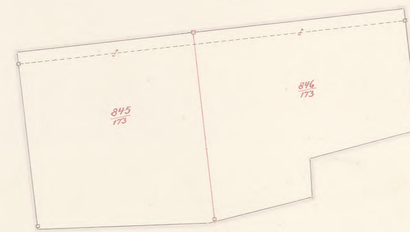
Nebenzeichnung 2. 1:1250.