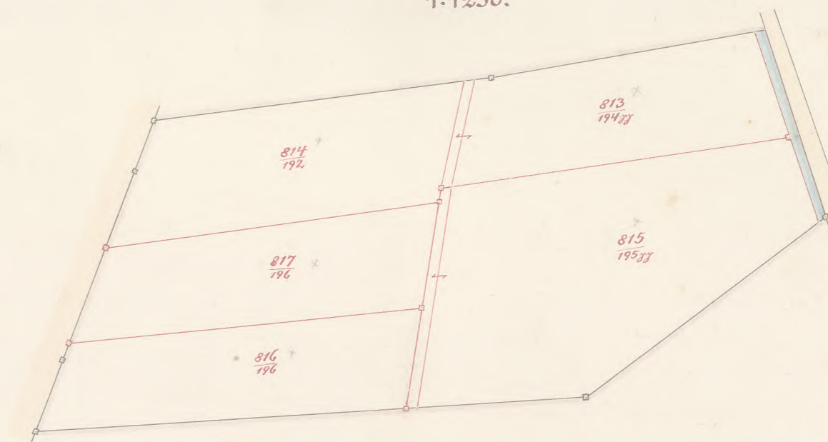
Nebenzeichnung 3. 1:1250.