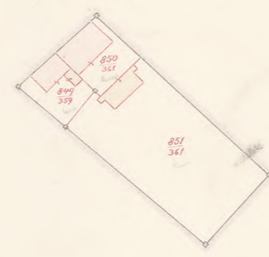
Nebenzeichnung 1. 1:1250.